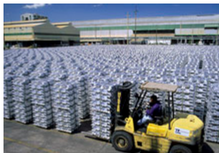
Алюминиевые изделия в Баркарене, Бразилия. МВФ окажет помощь странам Группы 20-ти в анализе того, насколько сочетаются основы их экономической политики и экономические прогнозы.