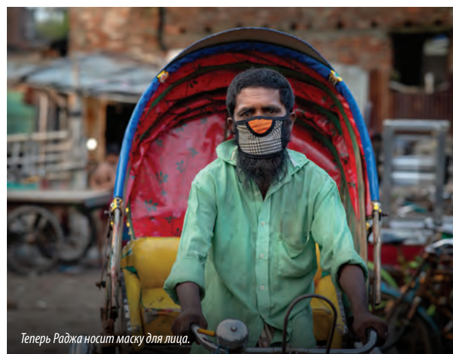
Теперь Раджа носит маску для лица.