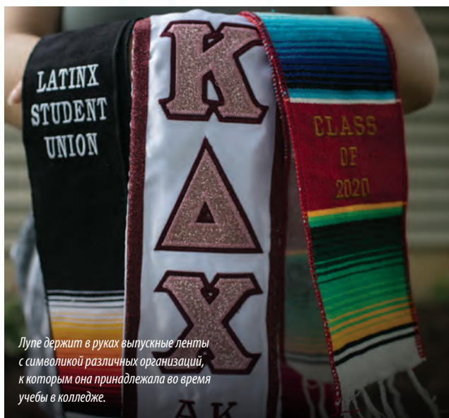
Лупе держит в руках выпускные ленты с символикой различных организаций, к которым она принадлежала во время учебы в колледже.