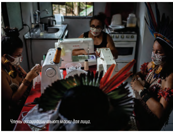
Члены ассоциации шьют маски для лица.