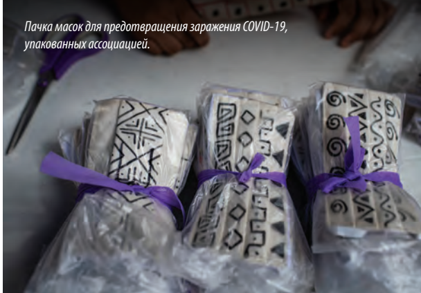
Пачка масок для предотвращения заражения COVID-19, упакованных ассоциацией.