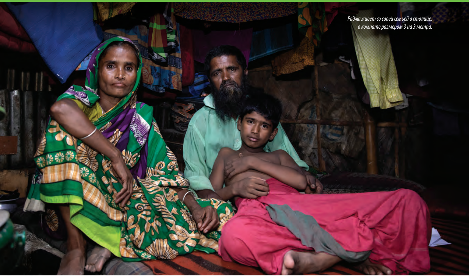
Раджа живет со своей семьей в столице, в комнате размером 3 на 3 метра.