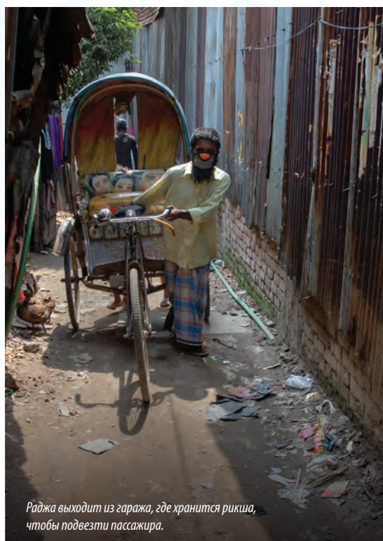
Раджа выходит из гаража, где хранится рикша, чтобы подвезти пассажира.