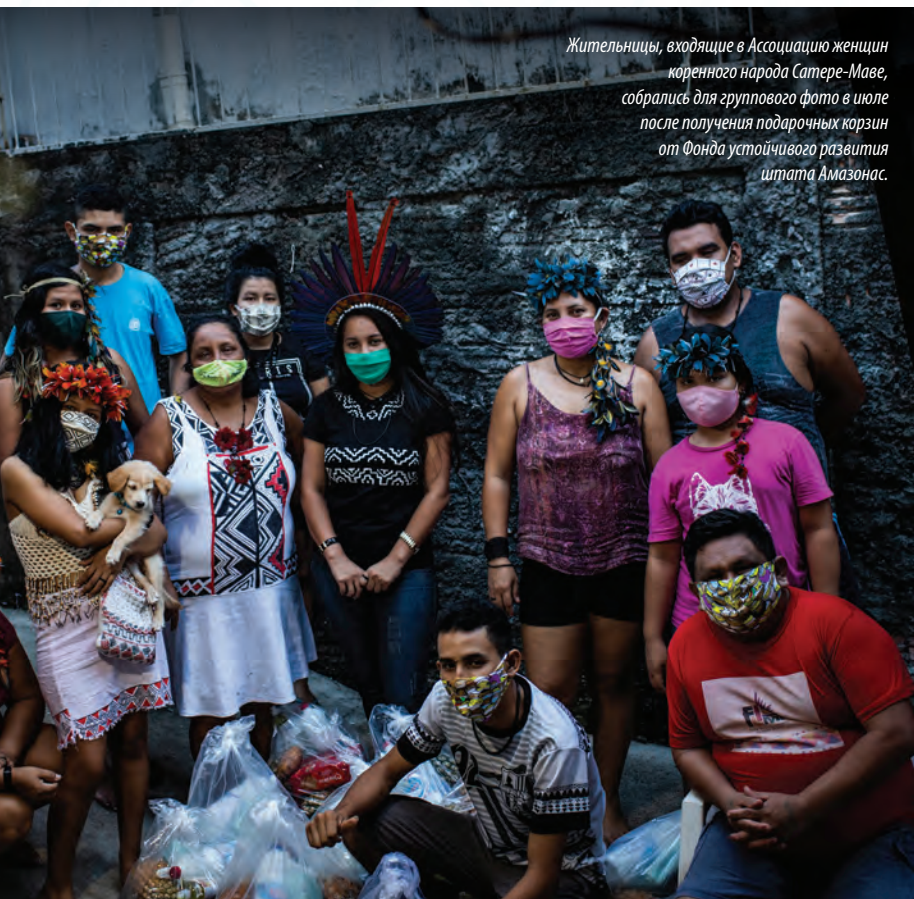
Жительницы, входящие в Ассоциацию женщин коренного народа Сатере-Маве, собрались для группового фото в июле после получения подарочных корзин от Фонда устойчивого развития штата Амазонас.