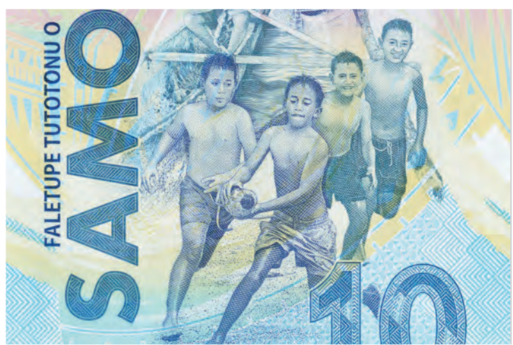
В 2019 году в Самоа была выпущена новая памятная банкнота в 10 тал в ознаменование Тихоокеанских игр, которые там проходили. Считается, что это первая углеродно-нейтральная банкнота в мире.

ствованию всей нашей тихоокеанской семьи». Выступая в 2019 году с речью в Организации Объединенных Наций, он заявил, что этот кризис касается не только маленьких островных или развивающихся государств. «Изменение климата не знает границ и для него не важны размер страны или ее экономическое положение», — заявил он.