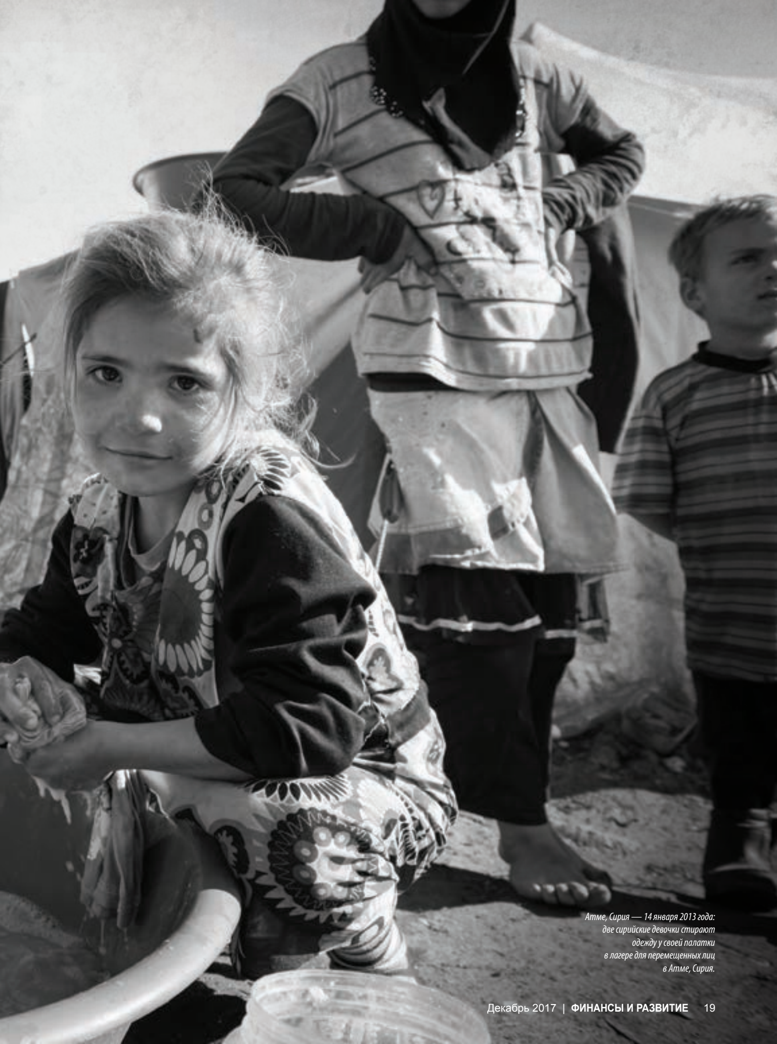
Атме, Сирия — 14 января 2013 года: две сирийские девочки стирают одежду у своей палатки в лагере для перемещенных лиц в Атме, Сирия.