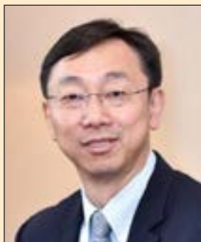
Тао Чжан — заместитель директора-распорядителя МВФ.

В ПОСЛЕДНИЕ годы темпы роста в странах с формирующимся рынком значительно опережают темпы более развитых стран. Уровень бедности снизился; возрос жизненный уровень. Но с этим быстрым ростом связана опасность того, что разрыв между богатыми и малоимущими в этих странах увеличится. Опросы общественного мнения, проведенные фирмой Pew Research, показывают, что большинство людей испытывает оптимизм относительно будущего в таких странах с формирующимся рынком, как Индия, Нигерия и другие, которые движутся в сторону статуса стран с развитой экономикой. Но мы должны обеспечить, чтобы рост в этих странах оставался всеобъемлющим, с тем чтобы такой оптимизм был оправдан.