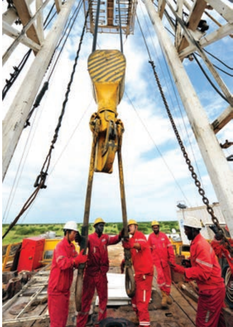
Китайские нефтяники из Бюро нефтеразведки «Чжунъюань» фирмы Sinopec вместе с суданскими коллегами бурят нефтяную скважину в Южном Судане.

Металлы, минеральное сырье и топливо составляют 70 процентов экспорта Африки к югу от Сахары в Китай. С другой стороны, большую часть импорта стран Африки к югу от Сахары из Китая составляет продукция обрабатывающей промышленности и машиностроения.