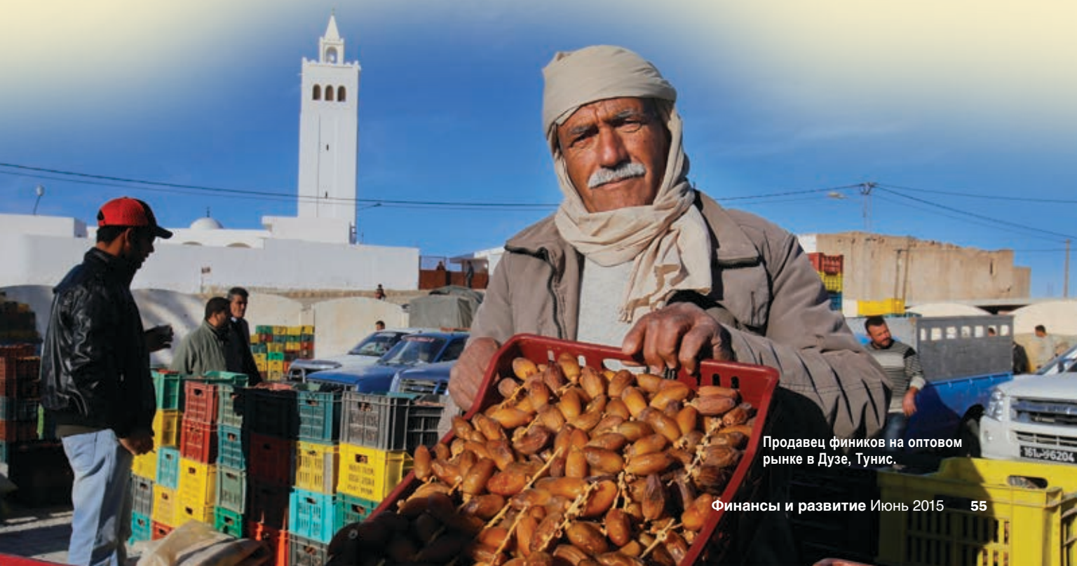
Продавец фиников на оптовом рынке в Дузе, Тунис.

Несмотря на достигнутые результаты, арабским странам на переходном этапе все еще необходимо устранить некоторые ключевые недостатки в их экономике