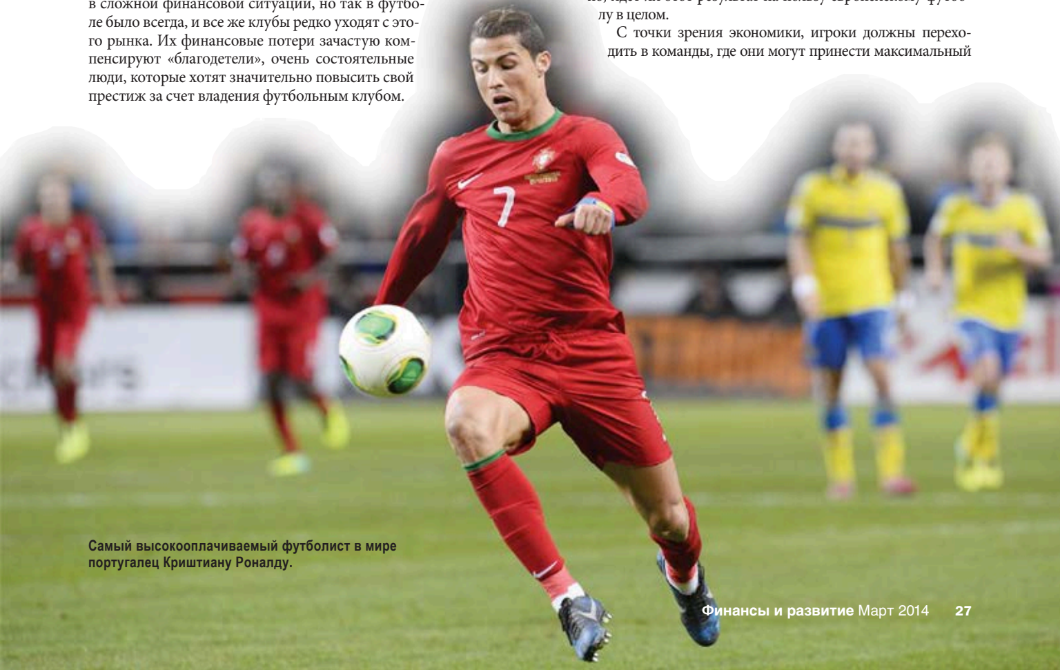
Самый высокооплачиваемый футболист в мире португалец Криштиану Роналду.

С точки зрения экономики, игроки должны переходить в команды, где они могут принести максимальный