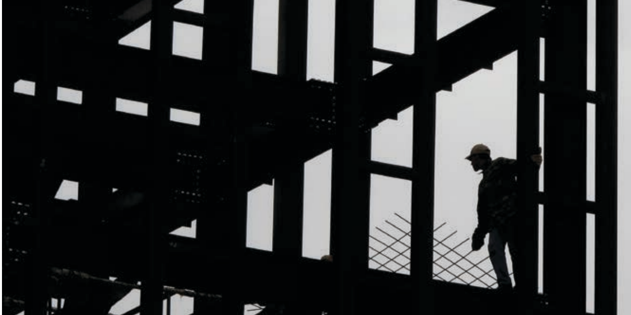
Рабочий на строительстве здания в Афинах (Греция).

которые не являются членами Европейского союза (Албания, Босния и Герцеговина, Косово, Македония, Сербия и Черногория), должны решить укоренившиеся проблемы, связанные с отложенным переходным процессом, неблагоприятным инвестиционным климатом и, как следствие, низким притоком прямых иностранных инвестиций.