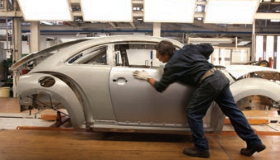
Сборщик на линии выпуска модели «Битл» завода «Фольксваген», Пуэбла, Мексика.