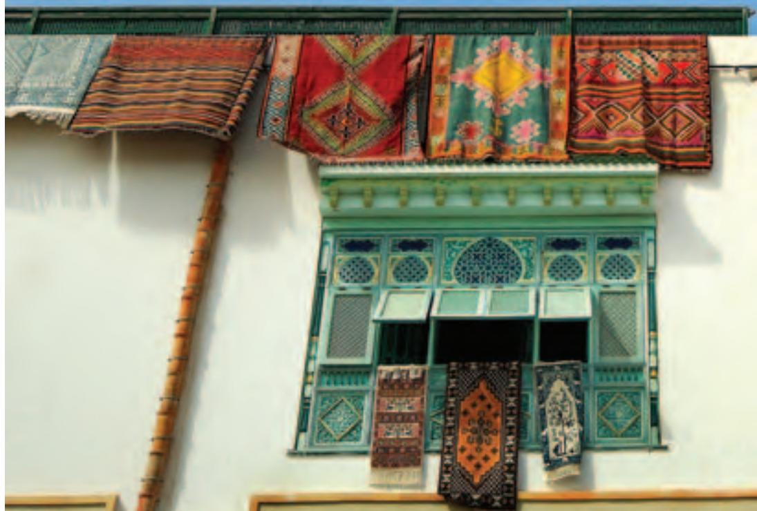
Магазин ковров в Мадии, Тунис.

Развитие частного предпринимательства с ведущей ролью нарождающегося среднего класса имеет ключевое значение для успешного перехода к демократии на Ближнем Востоке