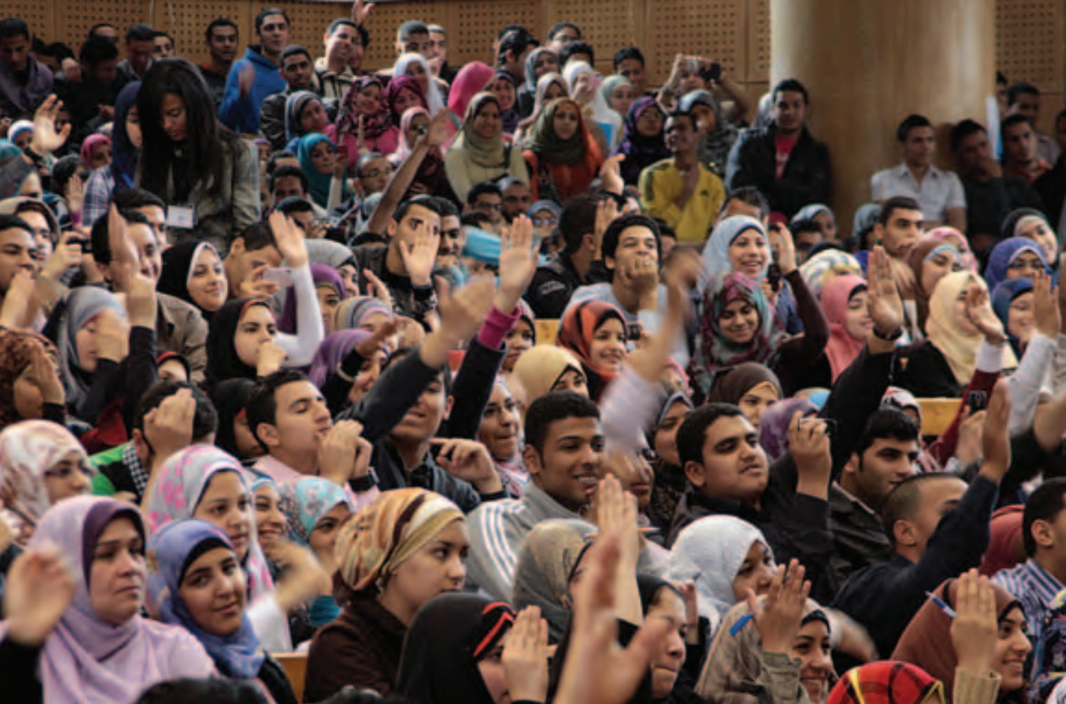
Молодежь на семинаре в Университете Айн-Шамс в Каире, Египет.