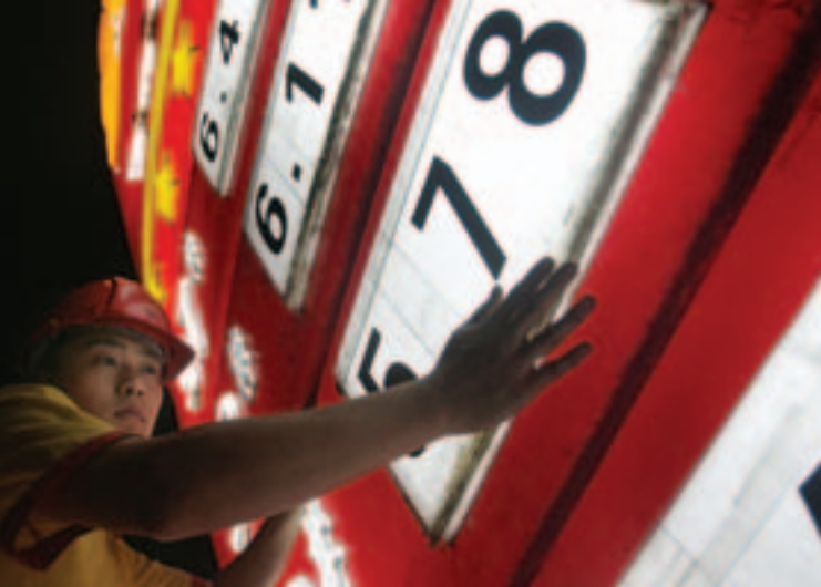
Работник исправляет цены на АЗС в Чунцине, Китай.

эффективных субсидий на ископаемое топливо». Новые усилия, направленные на отмену субсидий в этих странах, могут способствовать аналогичным реформам в других странах.