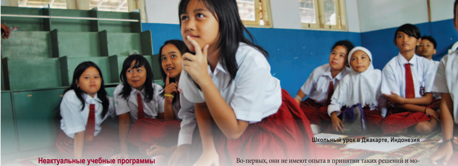
Школьный урок в Джакарте, Индонезия