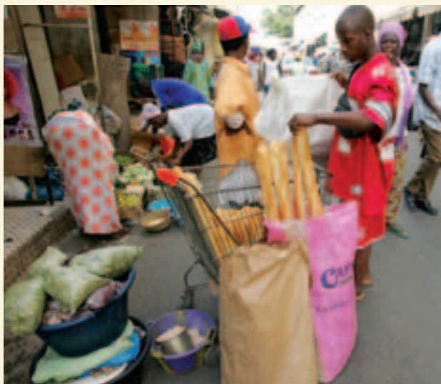
Покупатель в Дакаре, Сенегал, берет багет, приготовленный из импортированной пшеницы.

Страны нашей выборки, в которых беднейшие 25 процентов населения имели особенно хорошие результаты, также демонстрировали резкое повышение занятости в сельском хозяйстве, особенно в сельских районах. Таким образом, представляется, что доходы в сельском хозяйстве играют важную роль в обеспечении более всестороннего экономического роста.