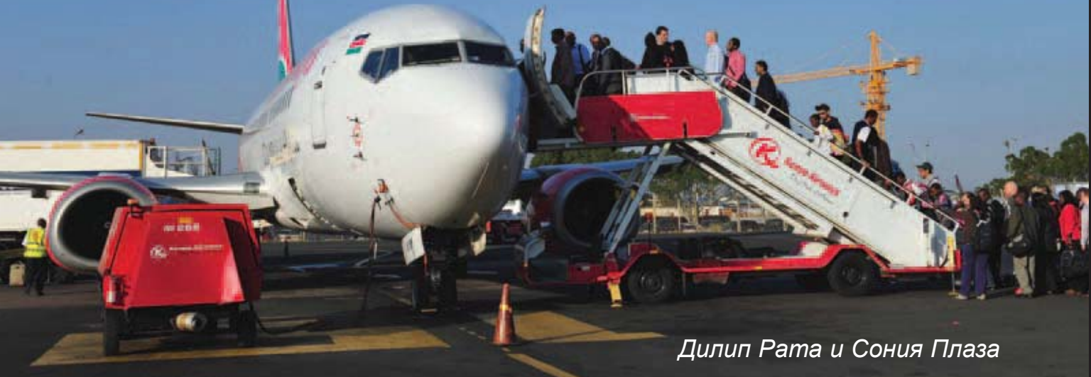
Дилип Рата и Соня Плаза

Африка может мобилизовать часть многомиллионной армии мигрантов в рамках мер, направленных на развитие