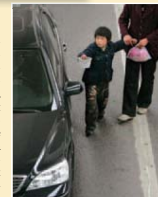
Попрошайки просят милостыню на дороге, Шанхай, Китай.

Новые данные ставят под вопрос общепринятое представление о связи между экономическим развитием и распределением дохода — что рост и снижение неравенства неразрывно связаны. Однако эта взаимосвязь, постулированная экономистом Саймоном Кузнецом, представляется не столь бесспорной, особенно в англоязычных странах, где имел место период снижения неравенства в первой половине XX века, а позднее — обратная тенденция начиная с 1970-х годов. Тем не менее гипотеза Кузнецца может быть обоснованной для многих бедных и развивающихся стран, которые еще не прошли начальную стадию индустриализации (См. «Более или менее» в этом выпуске Ф&Р).