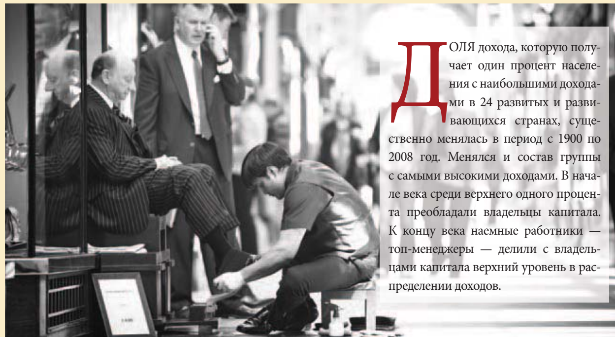
Бизнесмену чистят обувь, Лондон, Соединенное Королевство.

Неравенство доходов снова нарастает после снижения в первой половине XX века