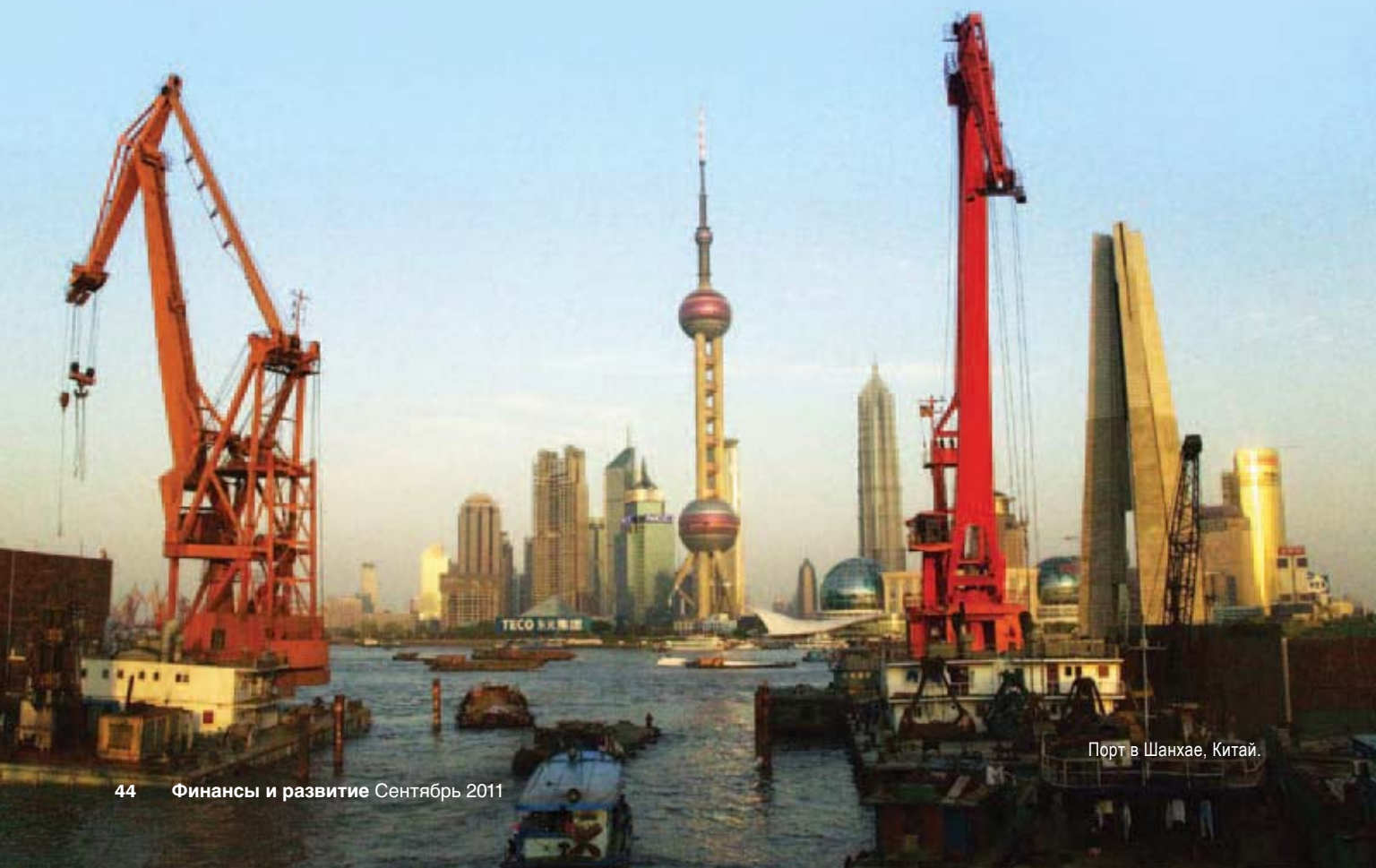
Порт в Шанхае, Китай.

После Второй мировой войны отмечался стабильный рост мировой торговли, ускорившийся в последнее десятилетие, при этом торговля несырьевыми товарами (в особенности высокотехнологичной продукцией, такой как компьютеры и электроника) возросла в 2008 году до более чем 20 процентов мирового ВВП. Для расширения мировой торговли были характерны три важные тенденции: выход на арену стран с формирующимся рынком как системно значимых торговых партнеров; растущая роль глобальных цепочек поставок; а также смещение высокотехнологичного экспорта