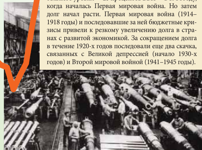
Производство вооружений в Германии, 1909 год.