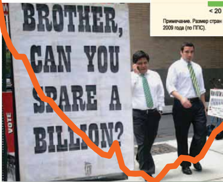
Рекламный щит в Нью-Йорке, США, 2008 год.

Примечание. Размер стран на диаграмме пропорционален их уровню ВВП 2009 года (по ППС).