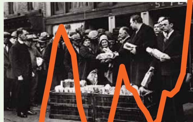
Очередь за продовольственной помощью в Нью-Йорке, США, 1930 год.