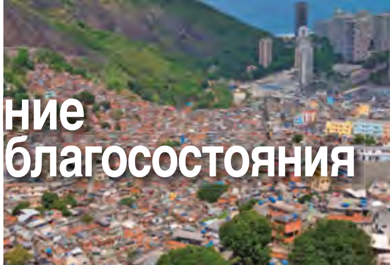
Фавела Росинья в Рио-де-Жанейро, Бразилия.

Неравенство доходов, как и бедность, уменьшилось в большинстве стран Латинской Америки и Карибского бассейна в первые годы XXI столетия. Согласно так называемому коэффициенту Джини, который используется для измерения равенства распределения дохода, в 15 из 18 обследованных стран региона: Аргентине, Боливии, Бразилии, Венесуэле, Гондурасе, Колумбии, Мексике, Никарагуа, Панаме, Парагвае, Перу, Сальвадоре, Уругвае, Чили и Эквадоре – произошло улучшение распределения дохода (см. рис. 2). По крайней мере в 11 из этих стран улучшение превысило 5 процентных пунктов. Только в Гватемале,