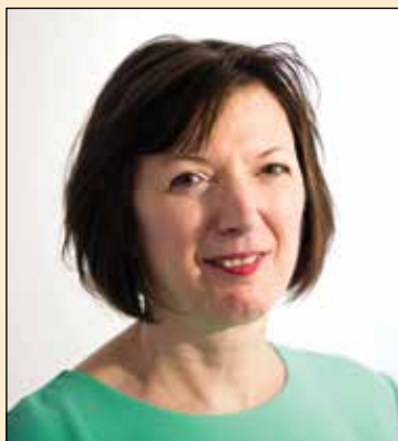
Frances O'Grady es Secretaria General del Congreso de Sindicatos del Reino Unido.

No solo aumentó el volumen del comercio internacional de bienes y servicios durante ese período, también lo hizo significativamente el flujo internacional de capital. Muchos países redujeron o eliminaron los controles sobre las entradas y salidas de capital con la idea de impulsar el crecimiento económico. Si bien