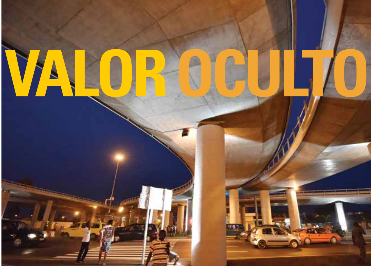
El puente Henri Konan Bédié, una asociación público-privada, conecta el norte y el sur de Abiyán, Côte d'Ivoire.