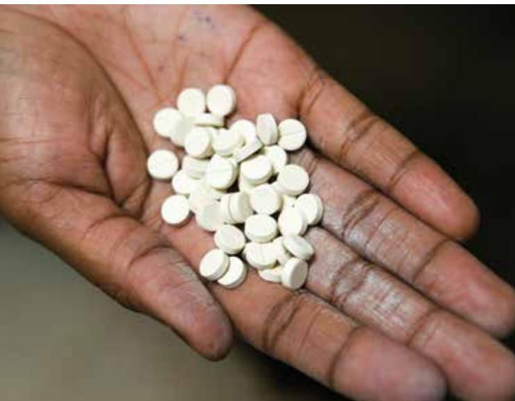
Medicamentos contra el sida, Programa Comunitario de Rehabilitación de VIH/SIDA, Orfanato y Clínica Pepo La Tumaini Jangwani, Isiolo, Kenya.

Por ejemplo, nuestras simulaciones basadas en los datos de Malawi muestran que la expansión de un programa de circuncisión de adultos quedaría justificada por la reducción de los pasivos fiscales que generaría, algo que no ocurriría expandiendo el tratamiento para fines preventivos. Los países africanos han logrado avanzar en algunos ámbitos, como la prevención de la transmisión de madres a hijos. Los programas que alientan a las niñas a no abandonar los estudios también han dado resultados prometedores (Santelli et al. , 2015), pero todavía faltan programas de prevención de calidad comprobada. En vez de volcar ingentes sumas de dinero para ampliar el tratamiento preventivo, quizá sea mejor probar otras estrategias de prevención, como las que buscan cambiar el comportamiento sexual, para ver cuáles dan mejor resultado.