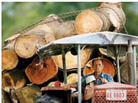
Aserradero de Río Frio, en Costa Rica, donde un proyecto pionero extrae energía de los desechos de la industria maderera.

El informe añadió que el acelerado aumento de la entrada de inversiones a África obedece en parte a las medidas de apertura a la inversión extranjera, como la rebaja de impuestos, la creación de zonas de inversión especial, el refuerzo a la promoción de inversiones, el fomento a la creación de empresas y la simplificación de los trámites de registro. Algunos países, sin embargo, establecieron condiciones menos favorables a la inversión extranjera como el cobro de regalías, la prórroga de monopolios estatales, la prohibición de transferencias de dinero y el tratamiento preferencial a sus ciudadanos.