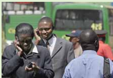
Usuarios de teléfonos móviles en Nairobi, Kenya: Un nuevo acuerdo intenta vincular electrónicamente las principales ciudades de África a más tardar en 2012.

En la cumbre se planteó que existe la tecnología para conectar a toda África y que esta acrecentaría los beneficios de las telecomunicaciones, como ha ocurrido con los teléfonos móviles, que son utilizados por agricultores y maestros para optimizar su trabajo, pese a que los costos de conexión en África son los más altos del mundo. También se expresó que los teléfonos móviles promueven la democracia ya que imprimen mayor eficiencia a las elecciones.