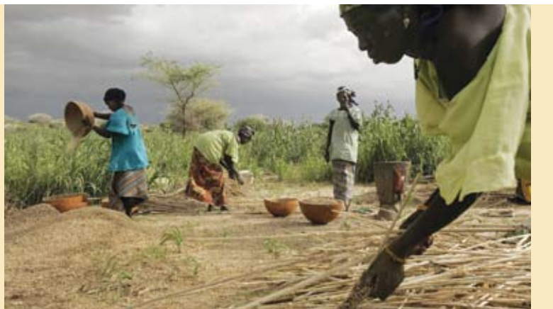
Cosecha del mijo en Malamkaka, Níger

El Banco Europeo de Reconstrucción y Desarrollo otorgará un préstamo de €20 millones (US$26,8 millones) a la ciudad de Surgut en Siberia occidental, Rusia, para construir cuatro nuevos conjuntos de viviendas que protejan a sus habitantes de las temperaturas de 50°F bajo cero que vive la región durante siete meses al año. Los 800 nuevos apartamentos serán más seguros y cálidos, y un 30% más eficientes desde el punto de vista energético.