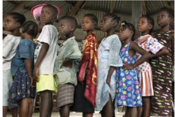
Niños liberianos esperan en fila para recibir la vacuna del sarampión.

Pobreza: Se está avanzando de forma sostenida hacia el logro del objetivo de reducir a la mitad para 2015 el nivel de la pobreza mundial de 1990; de hecho, el número de personas que viven en la pobreza extrema (con menos de un dólar diario) se ha reducido a menos de 1.000 millones por primera vez. Pero se ha perdido terreno en África subsahariana donde viven más del 30% de las personas en situación de pobreza extrema (un aumento con respecto al 19% en 1990 y 11% en 1991). Se prevé que Oriente Medio y el Norte de África alcancen este objetivo, aunque con escaso margen, y que Europa y