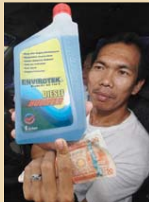
Un conductor de Filipinas muestra un aditivo para motores diesel obtenido del aceite de coco.

La presión del encarecimiento del petróleo y las crecientes limitaciones medioambientales están contribuyendo a que se reconozca cada vez más la necesidad de un cambio fundamental orientado a sustituir los combustibles fósiles por fuentes renovables de bioenergía, como la caña de azúcar o las semillas de girasol, según la Organización de las Naciones Unidas para la Agricultura y la Alimentación (FAO).