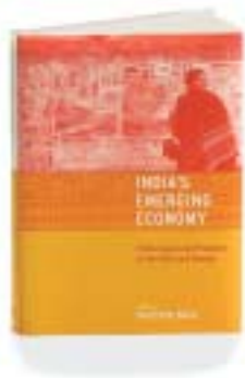
Kaushik Basu (compilador)

Estas actitudes están cambiando. Las reformas económicas han brindado oportunidades enormes a los jóvenes de las zonas urbanas, que tienden a considerar las empresas extranjeras más como una fuente de trabajo valiosa que