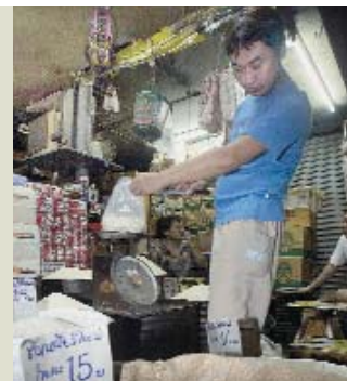
Sopesando el costo del arroz en Tailandia

producción de arroz enfrenta graves limitaciones por la reducción de la tierra y los recursos hídricos. Según la FAO, para 2030 la demanda total de arroz superará en un 38% a la producción total de 1997-99. La iniciativa será un catalizador para estimular a los programas impulsados por los países a elevar la producción arroceros. Véase más información en www.rice2004.org .