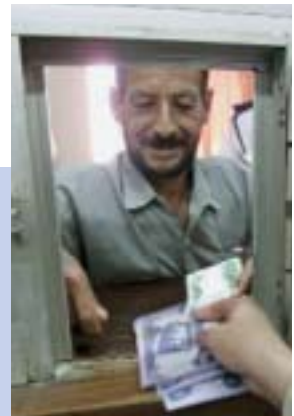
Nueva moneda en Bagdad

En Madrid, Kofi Annan apeló a los donantes para que hagan aportes generosos a Iraq, pero sin descuidar la ayuda a otros países. "No se deberían tomar recursos destinados a otras situaciones de emergencia graves y desviarlos a Iraq," afirmó. "Hay todo un mundo de sufrimiento; crisis profundamente arraigadas, desde los conflictos hasta la propagación del SIDA. Sin embargo, si existe voluntad, también existen los recursos para responder a todas esas crisis."