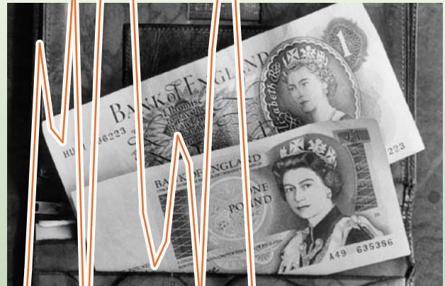
Устаревшие банкноты достоинством в один фунт, с тех пор замененные монетами.

Банку Англии удалось снизить инфляцию до более безопасных уровней в 1980-х годах. Его возможности по ограничению инфляционного давления в дальнейшем еще больше укрепились, после того как Банку Англии была предоставлена полная операционная независимость в проведении денежно-кредитной политики в 1997 году. Освобожденный от политического влияния и вооруженный четким мандатом по обеспечению стабильности цен, в последнее десятилетие Банк Англии был в состоянии удерживать инфляцию на целевом уровне. Завоеванное им доверие также позволило Банку Англии решительно перейти к ослаблению денежно-кредитной политики в последние месяцы по мере развертывания финансового кризиса.