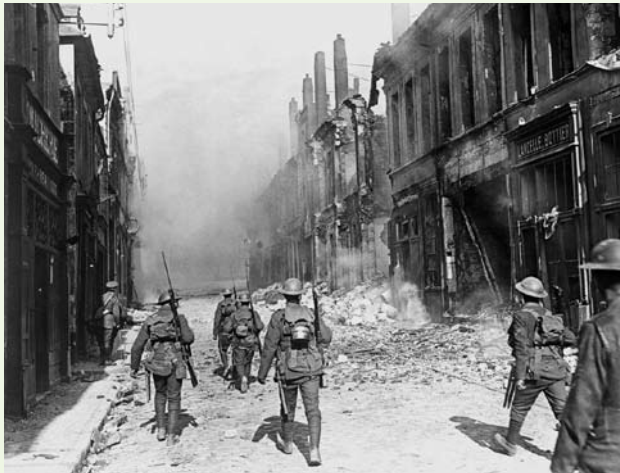
Британские войска вступают в Камбрэ, Франция, во время Первой мировой войны.