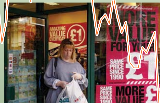
В последнее десятилетие Банк Англии удерживал инфляцию на целевом уровне.

Подготовили Андре Мейер и Саймон Уилсон, Международный Валютный Фонд.