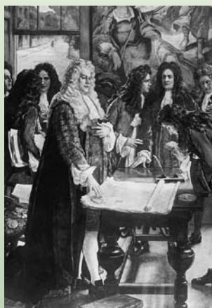
Создание Банка Англии королевским указом в 1694 году.