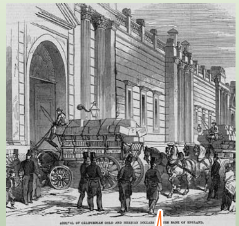
Золотой слиток из Калифорнии, доставленный в Банк Англии в 1849 году.

Банк Англии принял на себя дополнительные обязанности центрального банка в период с середины по конец 1800-х годов, став кредитором последней инстанции во время череды внутренних банковских кризисов. По мере того как расширение национальной и международной торговли приводило к образованию крупных клиринговых банков, Банк Англии поддерживал розничную банковскую систему как поставщик (и контролер) ликвидности.