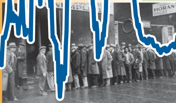
Скорректированная денежная база США, годовое изменение в процентах