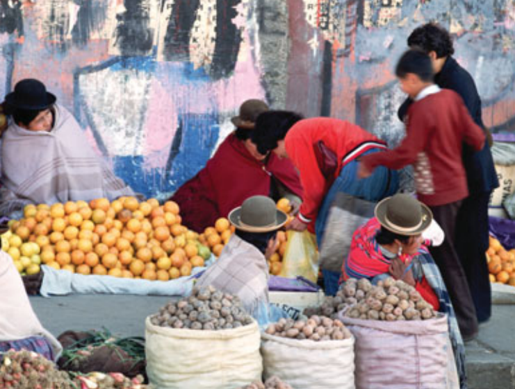
Уличный рынок в Ла-Пасе, Боливия.