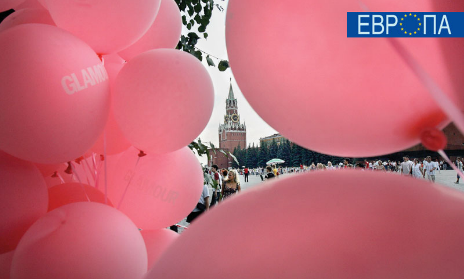
Спасская башня Кремля, Москва.