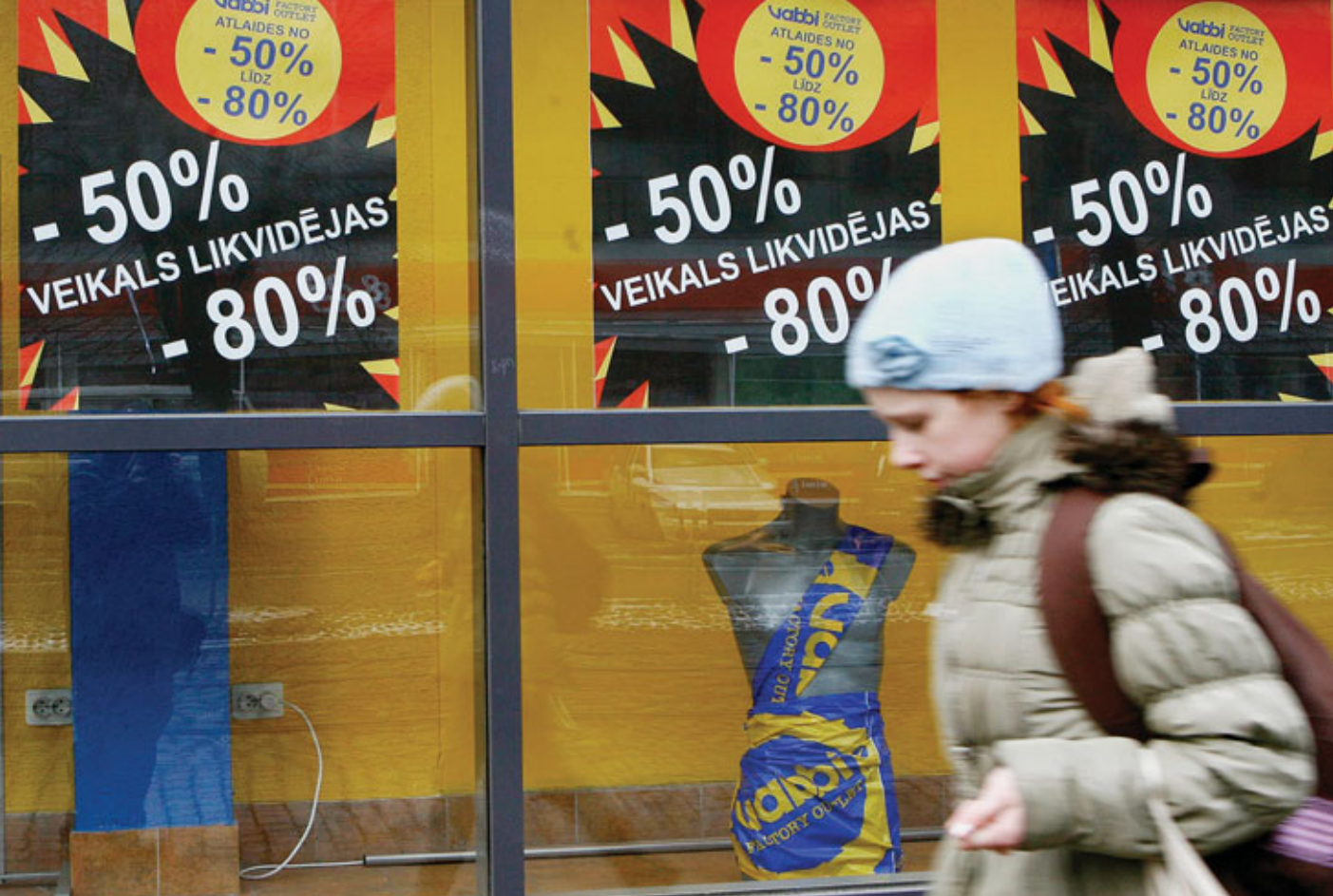
Девочка идет мимо витрины магазина в Риге, Латвия.

тому, от которого страдает мировая экономика в настоящее время. Недавнее предложение Европейской комиссии, основанное на докладе, подготовленном бывшим Директором-распорядителем МВФ Жаком де Ларозьером, должно стать важным шагом на пути к достижению этих целей повышения конкурентоспособности, однако в конечном итоге потребуется сделать гораздо больше.