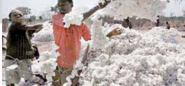
Сбор урожая хлопка в Боромо, Буркина-Фасо.