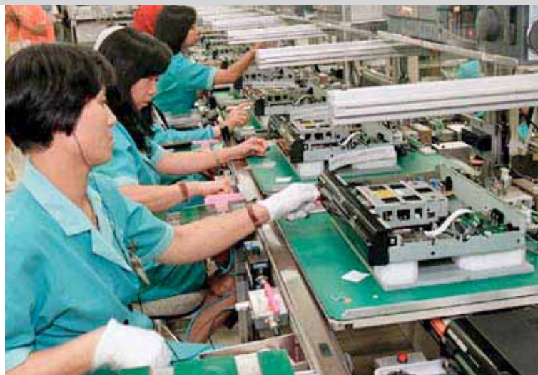
Линия по сборке проигрывателей видеодисков в Сингапуре.

Более того, текущий кризис наносит двойной удар по пошатнувшемуся Сингапuru. Воздействие оказывается как через торговые, так и финансовые механизмы.