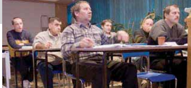
Курсы английского языка в Люблине, Польша.

Однако глобальная экономическая рецессия круто осадила кельтского тигра. Безработица резко возросла — с 4,8 процента в третьем квартале 2007 года до 7 процентов в тот же период 2008 года по данным КОДХ. Последствия сокращения производства были более болезненными для работников-иммигрантов, чем для граждан Ирландии. Аналогичным образом, больше иммигрантов, чем граждан Ирландии, зарегистрировалось в системе live register для подачи заявлений о выплате пособий в районные управления социального обеспечения. Уровень безработицы среди работников-неграждан составлял 9 процентов по сравнению с 6,1 процента среди граждан. С октября 2007 года по октябрь 2008 года число неграждан, регистрирующихся в live register, возросло на 100 процентов, по сравнению приростом на 52 процента среди граждан. Более высокий уровень безработицы среди мигрантов не вызывает удивления. Подавляющее