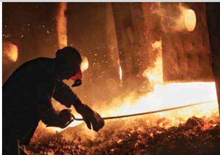
Сталелитейное предприятие в Донецке, Украина.

К началу ноября 2008 года цены на сталь упали более чем на 80 процентов по сравнению со своим почти пиковым уровнем в августе, в результате цены приблизились к своему долгосрочному трендовому уровню. Хотя скорость кор-