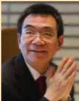
Джастин И-Фу Линь — старший вице-президент и главный экономист Всемирного банка.

Пересмотренная статистика бедности может углубить понимание процесса развития