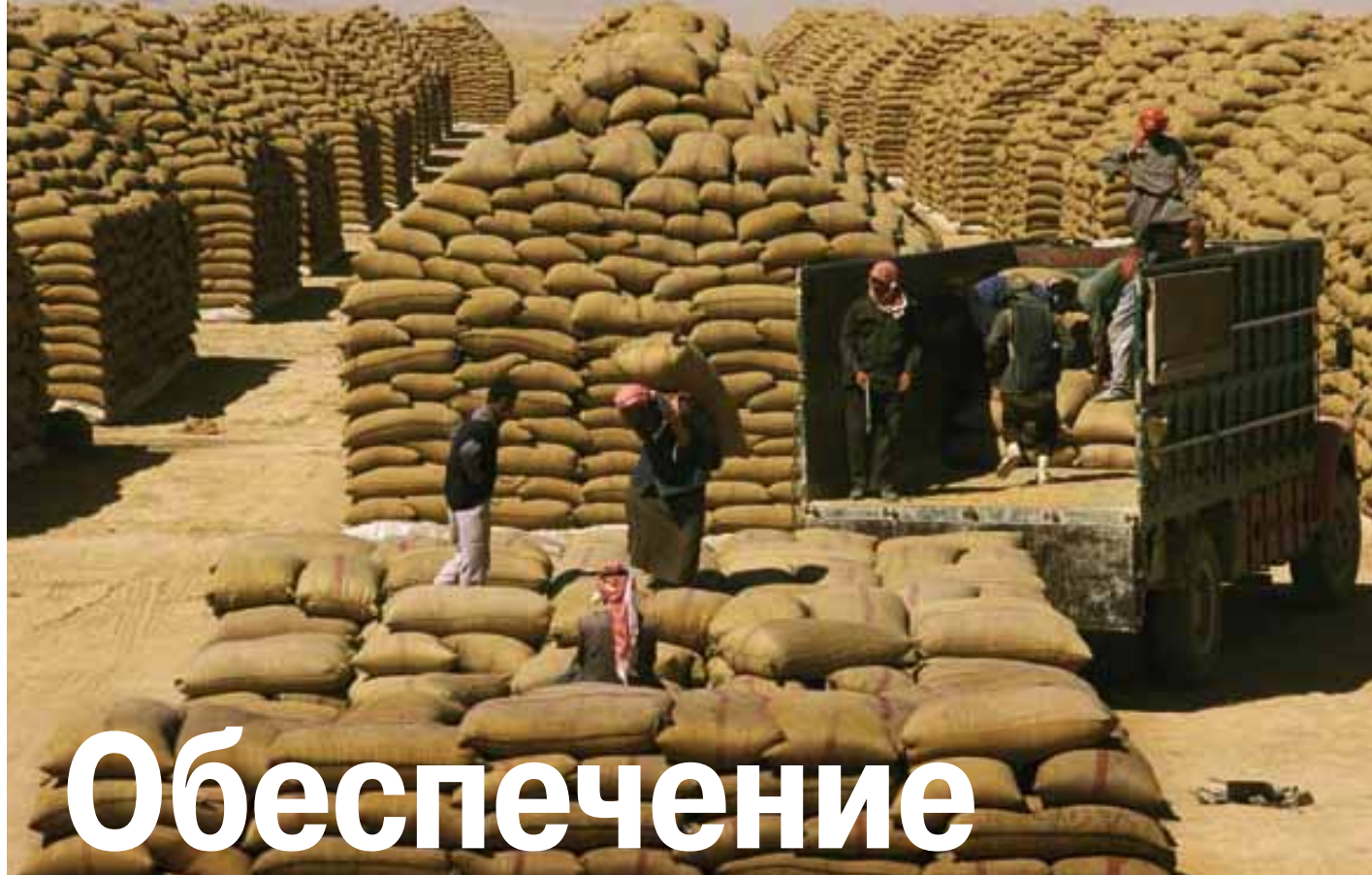
Мешки с пшеницей, Аль-Камшиш, Сирия.