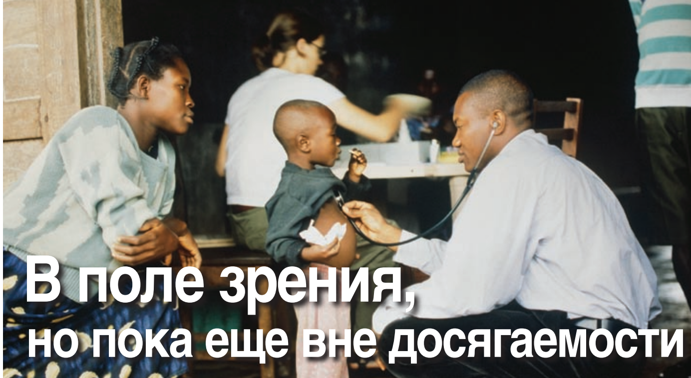
Врач лечит мальчика в Гане.