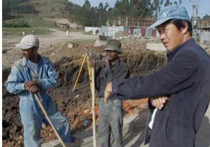
Китайский строитель руководит строительством дороги в Эфиопии.

Что касается инвестиций, то китайские государственные компании часто создают совместные предприятия с государственными компаниями стран АЮС, с тем чтобы иметь гарантированный доступ к источникам сырьевых товаров. В Анголе китайская компания SINOPEC инвестирует 3,5 млрд долл. США в совместный проект с компанией Sonangol для добычи нефти на недавно проданных через аукцион шельфовых участках и планирует построить нефтеперерабатывающий завод стоимостью 3 млрд долл. США. В Габоне консорциум СМЕС/Sinosteel, финансируемый Экспортно-импортным банком Китая, инвестирует приблизительно 3 млрд долл. США в разработку место-