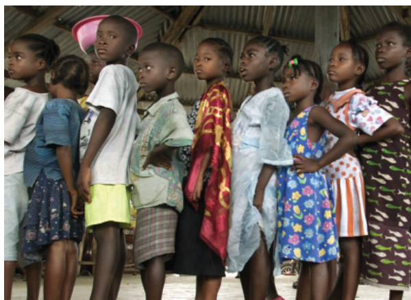
Либерийские дети стоят в очереди на получение прививок от кори.

Бедность. В общем и целом страны мира следуют намеченному курсу на достижение цели сокращения вдвое числа бедных к 2015 году по отношению к уровню 1990 года — действительно, число живущих в крайней нищете (менее чем на 1 доллар в день) впервые составляет менее 1 млрд человек. Однако страны Африки к югу от Сахары (АЮС) существенно отклоняются от намеченного курса: в настоящее время на этот регион приходится 30 процентов общемирового числа людей, живущих в крайней нищете (прирост по сравнению с 19 процентами в 1990 году и всего лишь 11 процентами в 1981 году). Ожидается, что Ближний Восток и Северная Африка достигнут целевого показателя, хотя и с трудом, а Европа и Центральная Азия, а также Латинская Америка и Карибский бассейн, вероятно, приблизятся к нему. Наиболее выдающиеся результаты отмечаются в странах Восточной Азии и бассейна Тихого океана и Южной Азии, которые, благодаря пора-