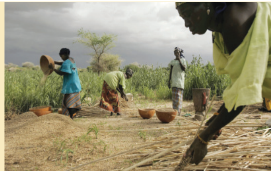
Крестьяне собирают урожай проса в Маламкаке, Нигер.

К числу других стран, сталкивающихся с трудностями, относятся Боливия, где засуха и наводнения нанесли ущерб большому числу фермеров, и Северная Корея, где рост внутреннего производства и расширение продовольственной помощи из Южной Кореи не ослабили озабоченность относительно продовольственного снабжения.