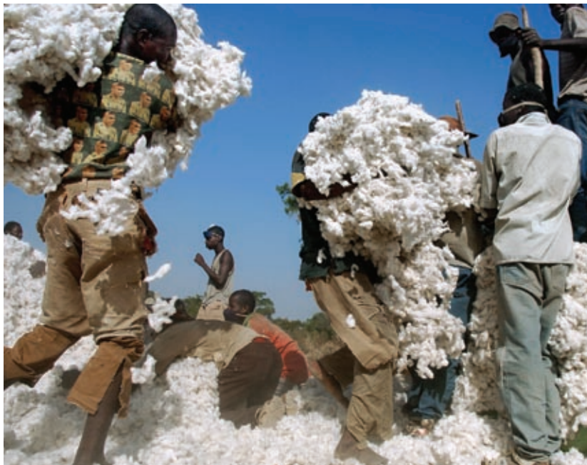
Сбор урожая хлопка в Буркина-Фасо.

По мере проявления выгод от облегчения бремени задолженности на многосторонней основе страны АЮС должны