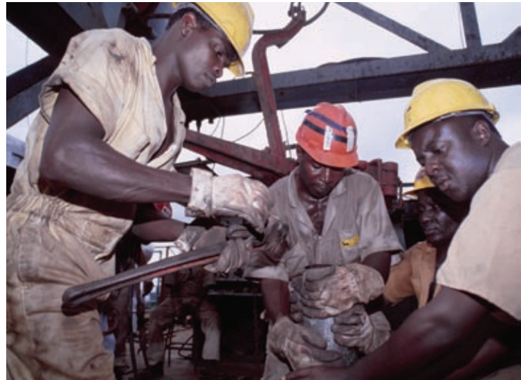
Рабочие-нефтяники в Нигерии.

Благодаря такой положительной ситуации рост доходов на душу населения составил примерно 3 процента, что значительно выше 0,8 процента в среднем за 1997–2001 годы (рис. 2), однако это намного ниже 5 процентов — уровня, необходимого странам АЮС, чтобы достичь Цели развития, провозглашенной в Декларации тысячелетия (ЦРТ) и предполагающей сокращение вдвое к 2015 году доли населения, живущего менее чем на 1 доллар США в день. Недавний всплеск экономического роста помог остановить рост бедности, который многие страны испытали в 1990-х годах, но для получения значительного чистого выигрыша потребуется время. Между тем, прогресс в достижении ЦРТ находится под угрозой; ожидается, что по меньшей мере 40 процентов стран АЮС не достигнут целей в области здравоохранения и образования (рис. 3).