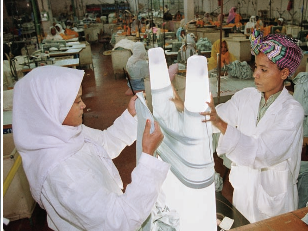
Слева направо: строительный рабочий в Руанде, производство золотых слитков в Южной Африке и контроль за качеством на текстильной фабрике в Эритрее.

и регионах продолжают конфликты. Проведение сильной макроэкономической политики и экономических реформ приносит плоды: наблюдается более быстрый и стабильный экономический рост, чем раньше, а инфляция снижается. Рекордные уровни резервов как в нефтедобывающих, так и нефтеимпортирующих странах служат буфером против внешних потрясений, таких как недавнее повышение цен на нефть. Положение стран, проводящих экономические реформы, улучшилось благодаря беспрецедентному по объемам облегчению бремени задолженности со стороны широкого круга кредиторов. Кроме того, международное сообщество пообещало значительно увеличить ресурсы помощи в предстоящие годы, и это раскрывает перед странами Африки новую возможность высвободить ресурсы и инвестировать в человеческий капитал и основные фонды в целях содействия устойчивому росту экономики. Эти изменения не остались незамеченными за рубежом. Иностранные инвесторы проявляют все больший интерес к африканскому континенту как на внутренних рынках долговых обязательств, так и в области прямых инвестиций в добычу природных ресурсов.