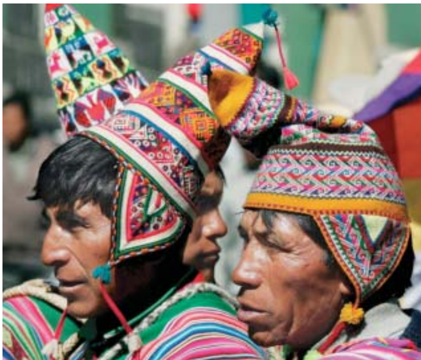
Индейцы штата Потоси в Боливии.

В докладе Всемирного банка от 1994 года были представлены убедительные доказательства слабости человеческого капитала (в плане образования и здоровья населения), являющейся главной причиной высокого уровня бедности, в сочетании со свидетельствами социального отчуждения путем дискриминации на рынке труда и ограниченного доступа к