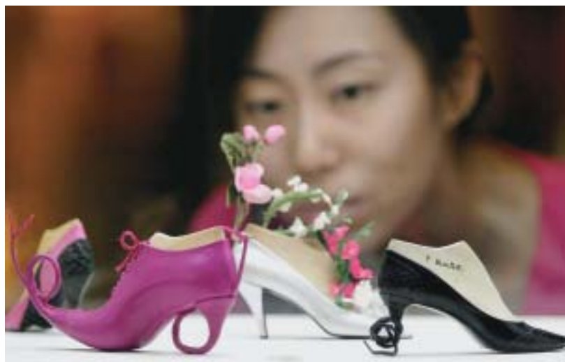
Миниатюрные туфли на итальянской торговой выставке в Пекине, Китай, где экономические реформы проводились постепенно, шаг за шагом.

Проводить реформы трудно из-за невозможности предсказать их последствия. Радикальный подход предполагает, что нам известна цель и пути ее достижения. Возможно, намеченная цель нам известна, но еще много неясного в том, как ее достичь. Рецепт успеха пока не составлен. Признание нашей неосведомленности означает, что нам следует двигаться вперед шаг за шагом, а не полагаться полностью на один всеобъемлющий план (McMillan and Naughton, 1992). В конечном итоге весь смысл рыночной экономики состоит в том, что она