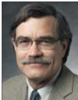
Джон Макмиллан — профессор экономики, стипендиат Фонда Джонатана Б. Лавлейса в Высшей школе бизнеса Стэнфордского университета в Калифорнии.

З А ПОСЛЕДНИЕ два десятилетия во всем мире произошел сдвиг в сторону рыночных отношений. Глобализация открыла внутренние рынки для международной конкуренции. Бывшие коммунистические страны преобразовались, в большей или меньшей степени, в рыночные экономические системы. В странах с низким уровнем дохода объем производства в государственном секторе сократился вследствие приватизации. Результаты этого расширения рынков были неоднозначными. Какие уроки для будущих реформаторов в развивающихся странах можно извлечь из опыта реформ в бывших коммунистических и развивающихся странах?