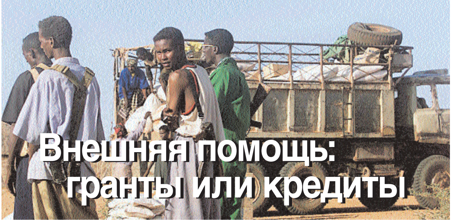
Идет разгрузка продовольственной помощи в пострадавшей от засухи южной части Сомали.