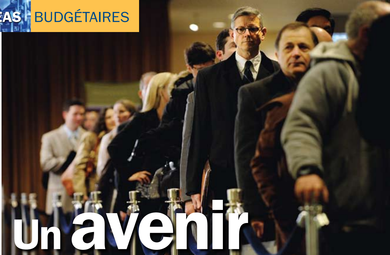
Affluence au salon de l'emploi à New York.