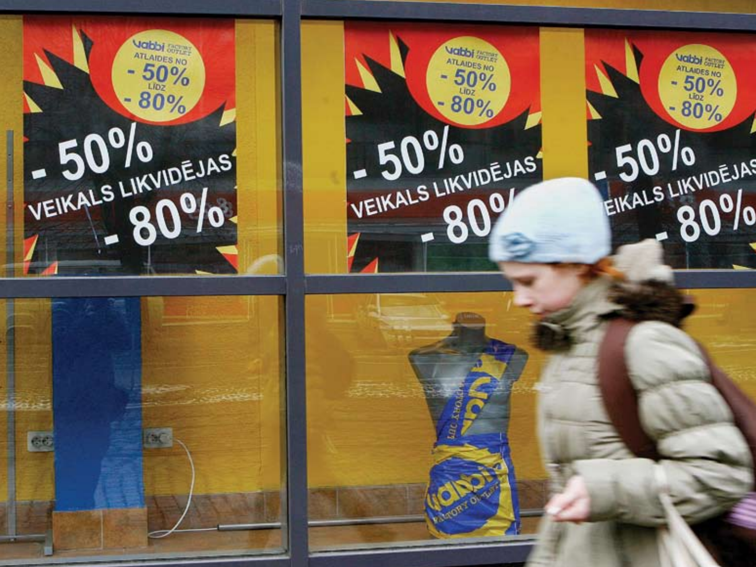
Une devanture de magasin à Riga.

Une autre leçon à tirer de la crise est l'urgence d'établir une surveillance macroprudentielle européenne pour éviter le type d'alternance expansion-récession qui accable aujourd'hui l'économie mondiale. La proposition faite récemment par la Commission européenne sur la base d'un rapport rédigé par Jacques de Larosière, ancien Directeur général du FMI, serait un pas important dans la bonne direction, encore que beaucoup restera à faire.