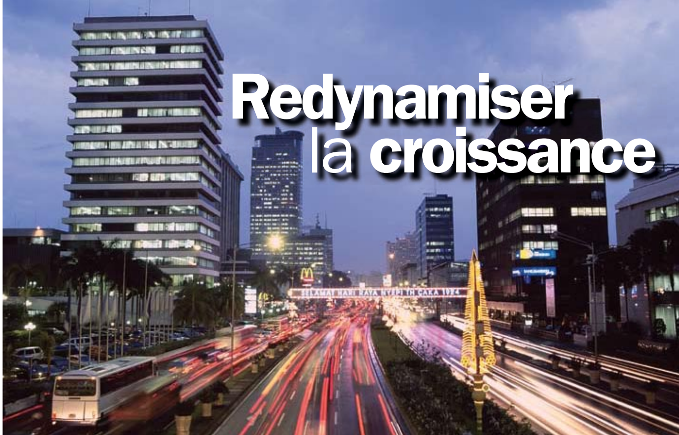
Effervescence nocturne dans la capitale indonésienne.

Les nations d'Asie de l'Est, membres du club des pays à revenu intermédiaire, devront peut-être actualiser leur stratégie de croissance