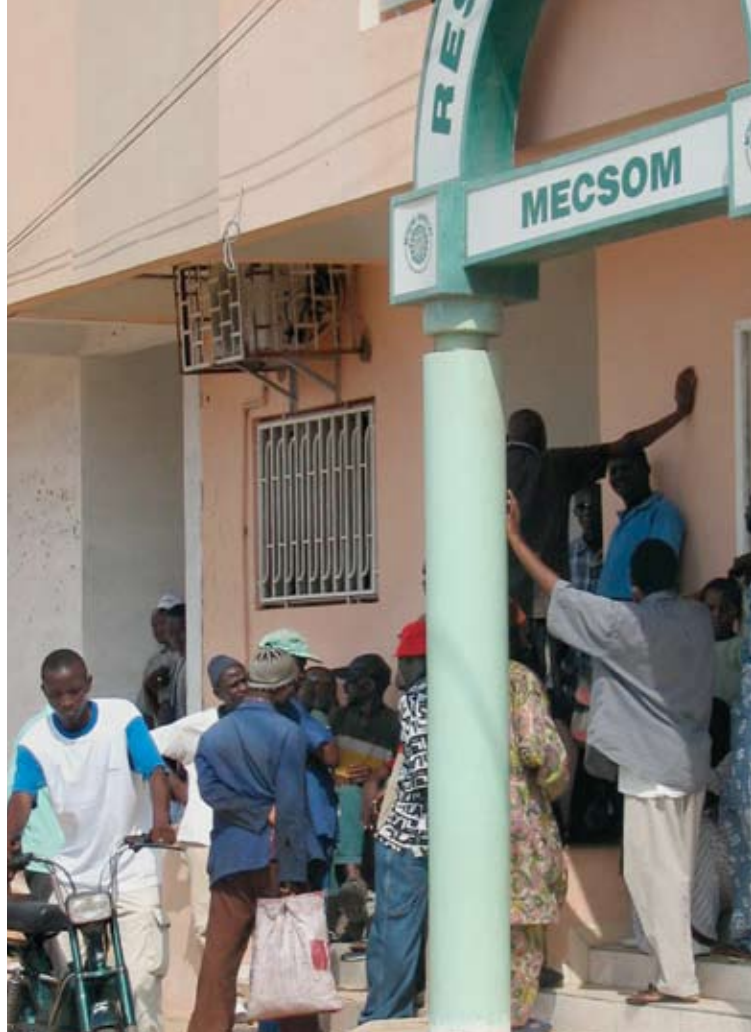
Une caisse d'épargne opérant à petite échelle au Sénégal.

Il va de soi que la pauvreté généralisée freine à la fois la demande et l'offre de dispositifs d'épargne. Le pourcentage de la population