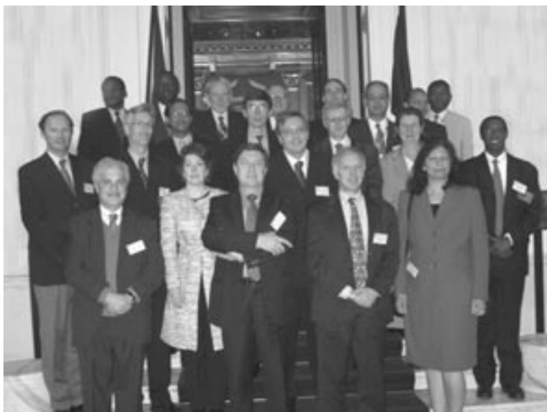
Integrantes del GTIEF en representación del BPI, la Secretaría del Commonwealth, el FMI, la OCDE, la UNCTAD y el Banco Mundial, en su reunión anual en la Secretaría del Commonwealth en Londres.

El GTIEF tomó nota de los avances en el desarrollo de las normas técnicas para el IDME y el JEDH, una labor que realiza el equipo del proyecto piloto IDME, en el cual participan el BPI, el FMI, la OCDE y el Banco Mundial. Según el programa, la labor de producción del JEDH concluirá al final de 2005.