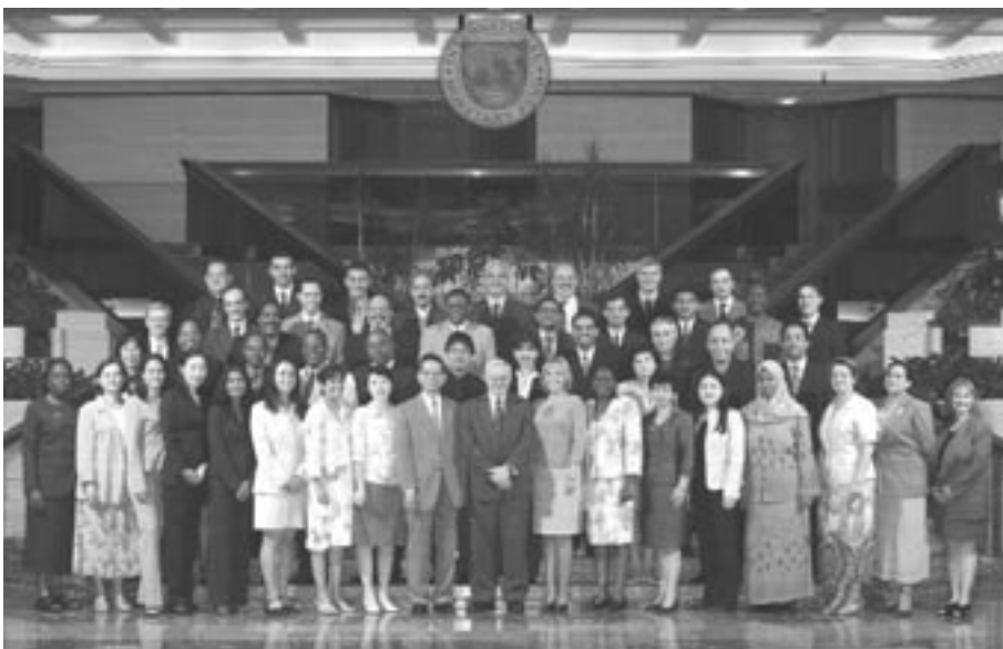
Participantes y funcionarios del FMI en el primer curso sobre estadísticas de la deuda externa en la sede del FMI en Washington (julio de 2005).

asistencia técnica en estadísticas de la deuda externa. Por ejemplo, el MECAD de las estadísticas de la deuda externa fue utilizado como material de trabajo por los participantes en el curso celebrado en la sede de la institución en julio de 2005. Además, puede ayudar a fortalecer el trabajo operativo del FMI a través de evaluaciones de la calidad de las estadísticas.