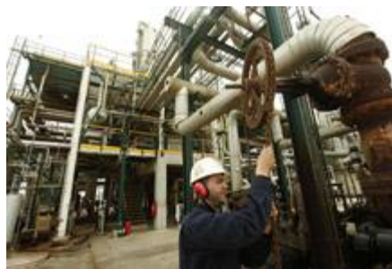
Raffinerie de pétrole à Zawya, en Libye. Les pays arabes en transition doivent gérer les attentes grandissantes de leur population