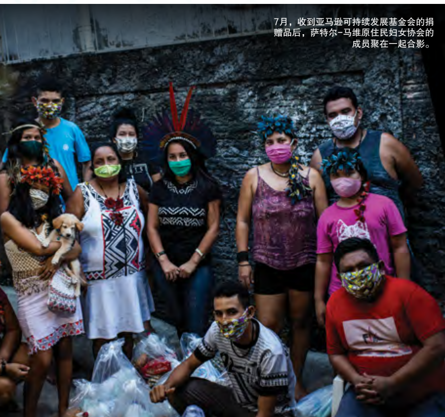
7月，收到亚马逊可持续发展基金会的捐赠品后，萨特尔-马维原住民妇女协会的成员聚在一起合影。