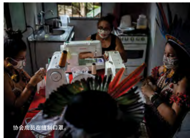
协会成员在缝制口罩。