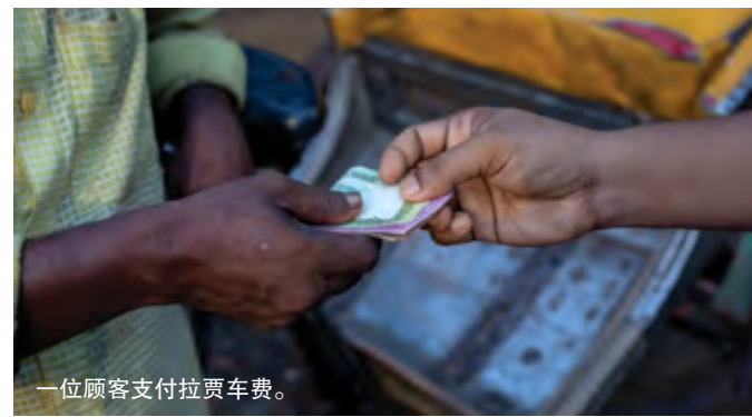
一位顾客支付拉贾车费。