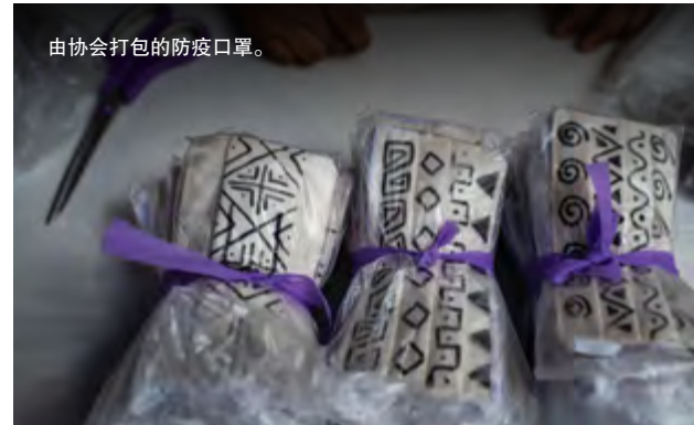
由协会打包的防疫口罩。